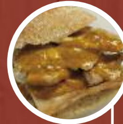
Pechuga con salsa de mostaza y miel