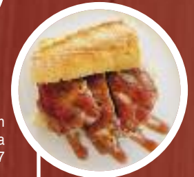
Chapatita recién de carrillera ibérica al 0'7