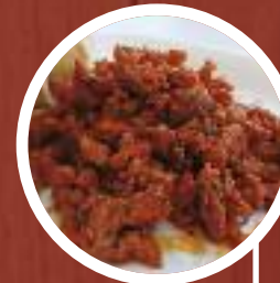
Chichas con adobo de la abuela