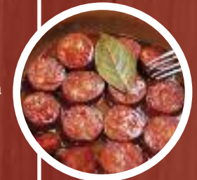
Chorizo a la sidra