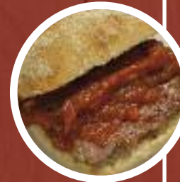
Solomillo con salsa Pedro Ximénez