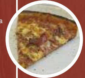
Pizza de la Casa